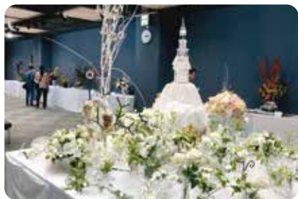
フラワーデザイン展