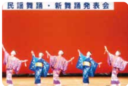
民謡舞踊・新舞踊発表会