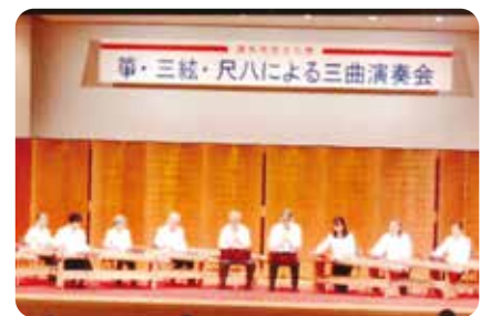
箏・三弦・尺八による三曲演奏会