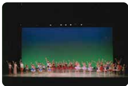
バレエ・フェスティバル