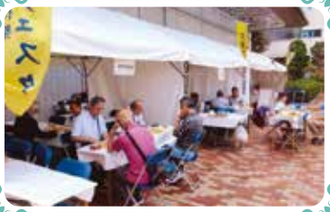
参加者対局と初心者指導