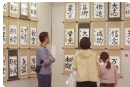
小・中学生書道展