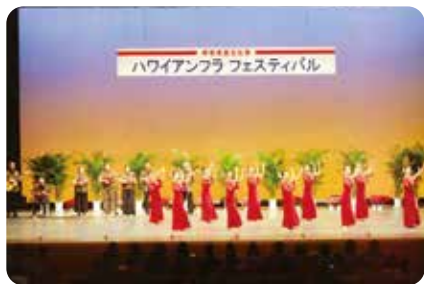
ハワイアンフラ フェスティバル