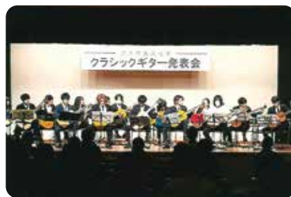
クラシックギター発表会