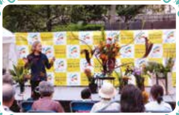
いけばなパフォーマンス