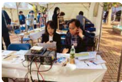
アマチュア無線の公開運用